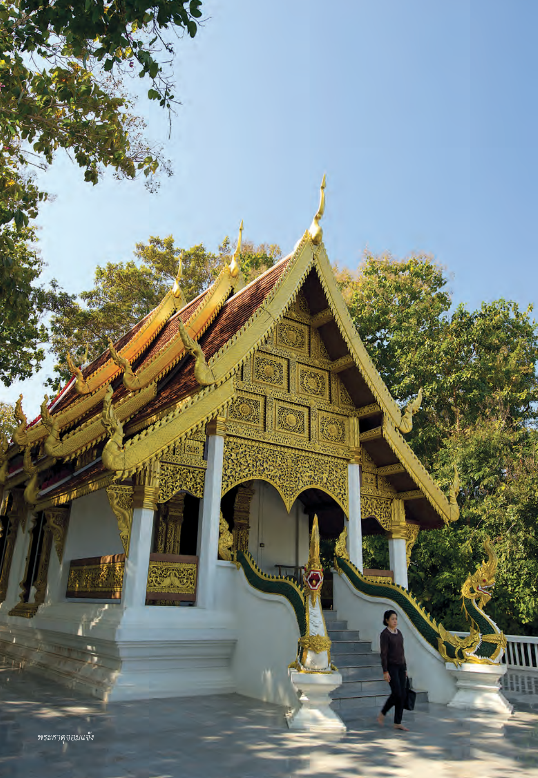
พระธาตุจอมแจ้ง