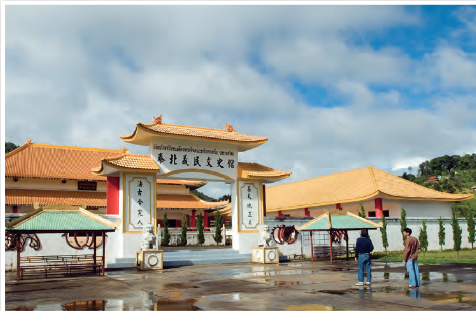
พิพิธภัณฑ์วีรชนอดีตทหารจีนคณะชาติ

พิพิธภัณฑ์วีรชนอดีตทหารจีนคณะชาติ สร้างขึ้นเพื่อระลึกถึงประวัติศาสตร์ของอดีตทหารจีนคณะชาติ