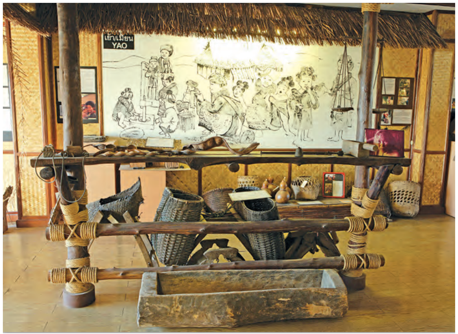
พิพิธภัณฑ์ชาวเขา

พิพิธภัณฑ์ชาวเขา ถนนธนาลัย จัดแสดงและฉายสไลด์วิถีชีวิตความเป็นอยู่ สิ่งของ เครื่องมือเครื่องใช้ ชุดแต่งกายประจำเผ่า รวมทั้งข้อมูลที่นำรู้เกี่ยวกับชาวอาข่า ลีซอ กะเหรี่ยง มูเซอ เย้า และม้ง เปิดให้เข้าชมวันจันทร์-ศุกร์ เวลา ๐๙.๐๐-๑๘.๐๐ น. วัน