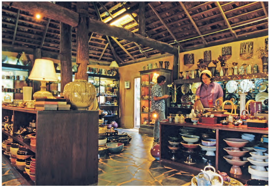
เครื่องปั้นดินเผาบ้านดอยดินแดง

ท่าดอนเป็นหมู่บ้านริมแม่น้ำกก เหนือขึ้นไปจากอำเภอฝาง ๒๔ กิโลเมตร จากเชียงใหม่มีรถประจำทางออกจากประตูช้างเผือกไปฝาง ใช้เวลาเดินทาง ๔ ชั่วโมง จากนั้นมีรถสองแถววิ่งประจำระหว่างฝางกับท่าดอน ใช้เวลา ๓๐ นาที และจากท่าดอนมีเรือหางยาวบริการถึงเชียงราย ออกจากท่าดอน เวลา ๑๒.๓๐ น. ถึงเชียงราย เวลา ๑๖.๓๐ น. และจากเชียงราย เวลา ๑๐.๓๐ น. ถึงท่าดอน เวลา ๑๕.๓๐ น. ระยะทาง ๘๐ กิโลเมตร ค่าโดยสารคนละ ๓๕๐ บาท ถ้าหากต้องการเช่าเรือเหมาลำ ราคา ๒,๒๐๐ บาท นั่งได้ ๘ คน สอบถามข้อมูลได้ที่ชมรมเรือบ้านท่าดอน โทร. ๐ ๕๓๐๕ ๓๗๒๗ นอกจากนี้ยังมีบริการล่องแพตามลำน้ำกกจากท่า