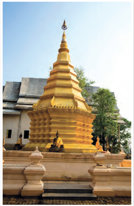
พระธาตุจอมจันทร

สถานีเพาะเลี้ยงสัตว์ป่าแม่ลาว เป็นสถานีเพาะพันธุ์ สัตว์ป่าบนพื้นที่หน่วยจัดการต้นน้ำแม่ส้าน ตำบลจอมหมอกแก้ว ซึ่งมีสภาพป่าและพื้นที่เหมาะสมต่อการดำเนินการเพาะเลี้ยงสัตว์หลายชนิด เช่น กวางป่า อีเก้ง เสือลายเมฆ เสือปลา หมีควาย หมีขอ อีเห็น นกยูง ไก่ฟ้า นกเป็ดแดง และเต่าเหลือง เปิดให้เข้าชม ทุกวัน เวลา ๐๘.๐๐-๑๗.๐๐ น. สอบถามข้อมูล โทร. ๐๘ ๑๘๘๒ ๔๔๐๔, ๐๘ ๙๙๙๙ ๘๘๑๖