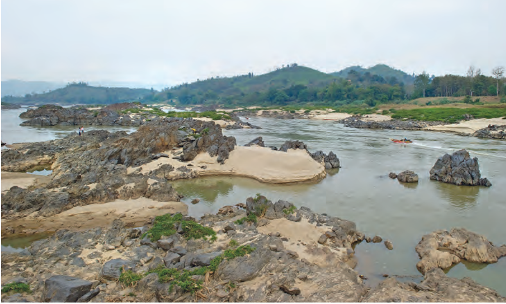
แก่งผาได