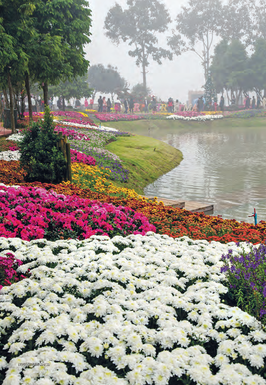
เทศกาลดอกไม้งาม