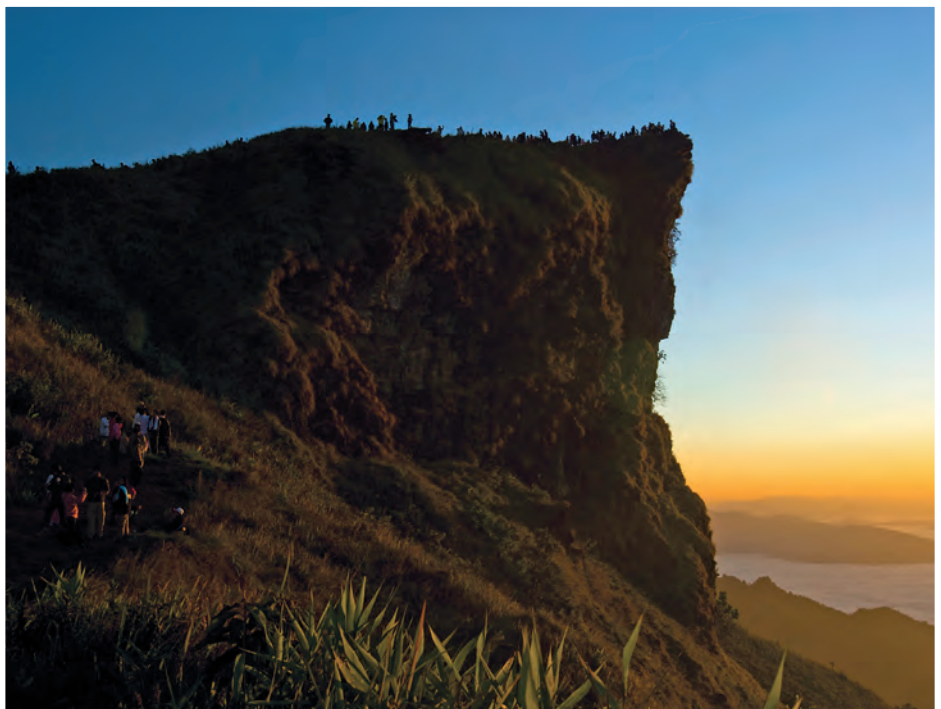
วนอุทยานภูชี้ฟ้า

ถ้ำมัลติคาเทวี หรือถ้ำพญานาค เป็นถ้ำขนาดเล็ก อยู่ใต้หน้าผาบนภูเขา ภายในถ้ำมีหินงอกขนาดใหญ่ คล้ายงูแผ่แม่เบี้ย สูง ๒.๕ เมตร อยู่ตรงบริเวณปากถ้ำ ถ้ำเสียงผา เกิดจากการยุบตัวของแผ่นดินจึงทำให้เกิดลักษณะที่เป็นเว้งมีหุบเหวล้อมรอบ กว้างประมาณ ๘๐ เมตร สูงประมาณ ๓๐ เมตร บริเวณถ้ำยังพบฟอสซิลหอยฝาเดียวและหอยสองฝาอายุหลายร้อยล้านปี ในอดีตเสียงผาบนภูเขาจะลงมาकिनน้ำฝนที่ไหลลงมาซึ่งภายในถ้ำ จึงเป็นที่มาของชื่อ “ถ้ำเสียงผา”