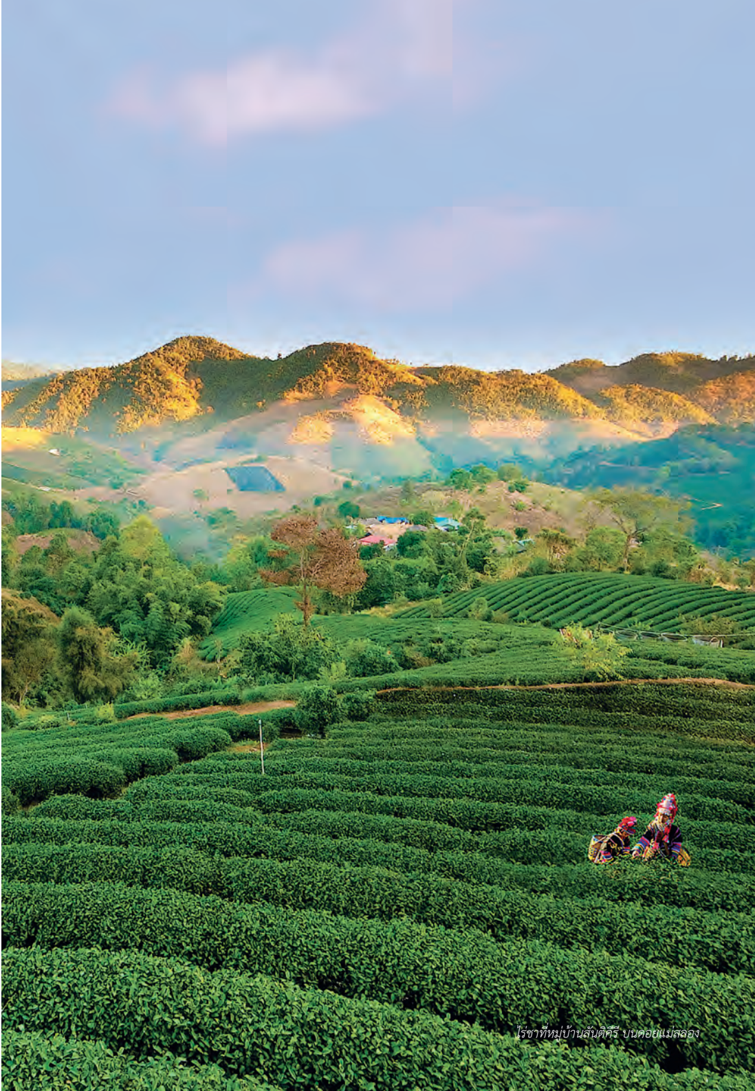
ไร่ชาที่หมู่บ้านสันติคีรี บบต๋อยแม่ฮ่องสอน