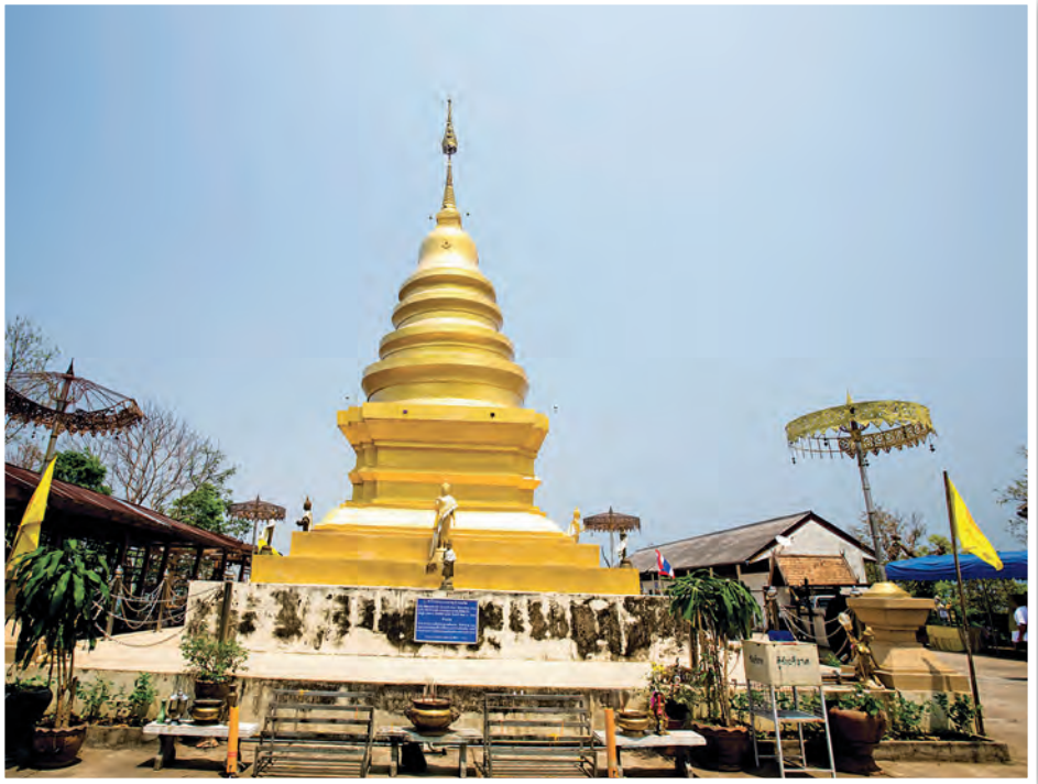
พระธาตุจอมจ้อ

ขุนน้ำนางนอน ห่างจากถ้ำหลวง ๒ กิโลเมตร มีธรรมชาติที่สวยงามมีน้ำ มีบึงน้ำจืดขนาดเล็ก บนหน้าผาเหนือบึงน้ำยังเป็นที่ตั้งของถ้ำทรายทองซึ่งยังไม่มีการสำรวจภายใน สอบถามข้อมูล โทร. ๐ ๕๓๗๑ ๔๙๑๔