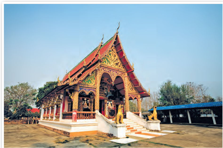
วัดพระเจ้าทองทิพย์

ศาลพระเจ้าจิ้ง ตั้งอยู่ที่บ้านวังขมภู ตำบลม่วงคำ เป็นอาคารสูงทรงจีน ๕ ชั้น ชั้นบนเป็นที่ประทับของ พระอรหันต์จิ้งองค์ใหญ่ ขนาดหน้าตักกว้าง ๗.๖ เมตร สูง ๘.๘ เมตร น้ำหนัก ๓ ตัน ด้านล่างเป็นที่สำหรับประกอบพิธีกรรม มีที่พักสำหรับผู้มาร่วม พิธีกรรมในวันสำคัญต่าง ๆ