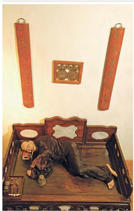
หอผืนอุทยานสามเหลี่ยมทองคำ

หอผืนอุทยานสามเหลี่ยมทองคำ เป็นสถานที่จัด นิทรรศการแสดงเรื่องราวของผืนในสามเหลี่ยม ทองคำตั้งแต่ต้นกำเนิดผืน สงครามผืน ผู้นำผืนเข้า มาในเอเชียขบวนการค้ายาเสพติดผลกระทบของผืน การยุติการดำรงชีวิตที่ต้องพึ่งพิงกับการปลูกผืนและ เสพผืนอุปรณ์การสูบและขายผืนจากทั่วโลก การ ฟื้นฟูสภาพชีวิตประชาชน มีการจัดลำดับและเนื้อหา เป็นขั้นตอน ประกอบด้วยแสง สี เสียง ซึ่งจะใช้