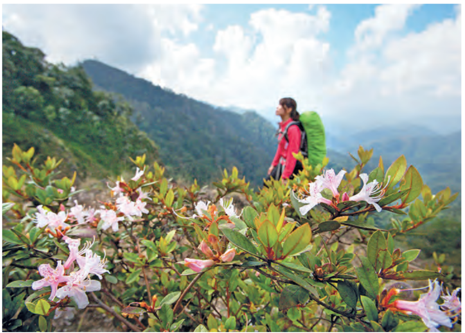
ดอยลังกาหลวง