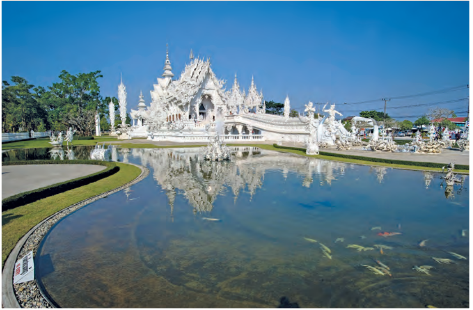
วัดร่องขุน

ในโอกาสสมหามงคลพระราชพิธีเฉลิมพระชนมพรรษา ครบห้ารอบ ซึ่งได้เสด็จมาเฉลิมเสาศาสติเมือง เมื่อวันที่ ๒๗ มกราคม พ.ศ. ๒๕๓๑