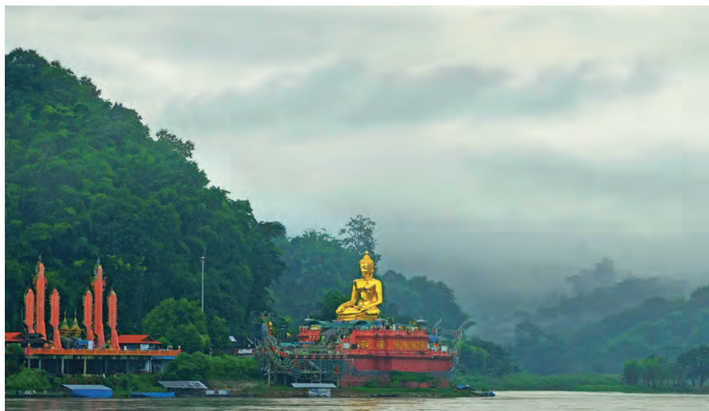
สามเหลี่ยมทองคำ