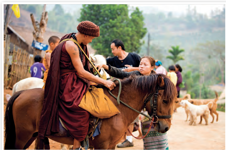
วัดถ้ำป่าอาชาทอง

เมตร สูง ๑๕.๑๐ เมตร และพระเจดีย์ฐานกว้าง ๑๓x๑๓ เมตร สูง ๑๐ เมตร เป็นศูนย์รวมจิตใจของชาวเชียงราย บริเวณองค์พระธาตุเจดีย์ยังเป็นจุดชมวิวดัวเมืองเชียงรายที่สวยงาม สามารถเห็นสภาพตัวเมืองเชียงรายได้ ๑๘๐ องศา สอบถามข้อมูล โทร. ๐ ๕๓๗๑ ๖๔๓๖