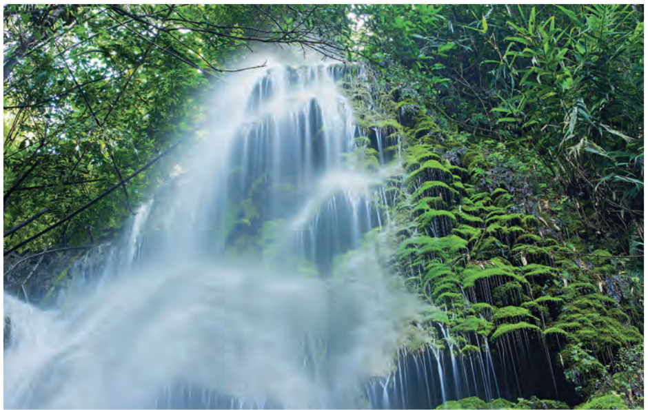
น้ำตกปูแกง

การเดินทาง จากอำเภอเมืองเชียงรายมาตามถนนสายเชียงราย-แม่จัน ๑๑ กิโลเมตร แล้วต่อด้วยทางหลวงหมายเลข ๑๒๐๙ อีก ๒๙ กิโลเมตร สอบถามข้อมูล โทร. ๐ ๕๓๙๑ ๘๒๓๔