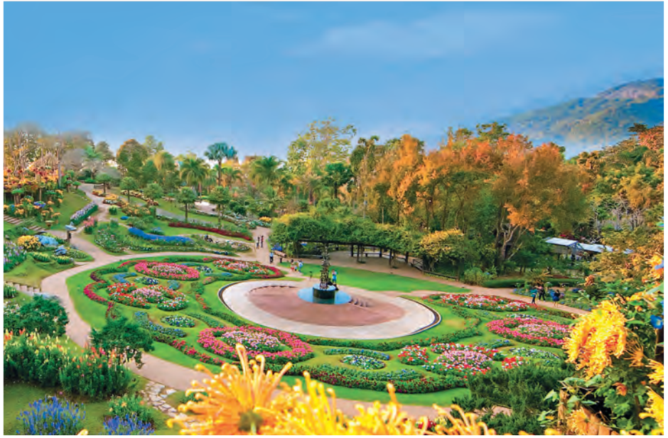
สวนแม่ฟ้าหลวง

ถึงที่ทำการหน่วยพิทักษ์อุทยานฯ แล้วเดินเท้าไป ยังตัวน้ำตกอีก ๓๐ นาที ระยะทาง ๑,๔๐๐ เมตร สอบถามข้อมูล โทร. ๐๘ ๑๓๘๗ ๕๓๕๔, ๐ ๕๓๗๑ ๑๔๐๒ ต่อ ๗๐๑