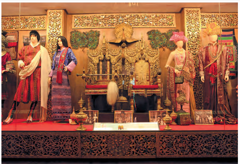
พิพิธภัณฑ์อูบคำ

น้ำตกขุนกรณ์ อยู่บนทิวเขาตอยช้าง ตำบลแม่กรณ์ ในเขตอุทยานแห่งชาติลำน้ำกก น้ำตกขุนกรณ์มีความสูง ๗๐ เมตร สองข้างทางเดินเข้าสู่น้ำตกเป็นป่าร่มรื่น การเดินทาง ใช้ทางหลวงหมายเลข ๑๒๑๑ ระยะทาง ๑๘ กิโลเมตร เลี้ยวขวาเข้าไป ๑๑ กิโลเมตร ตามทางหลวงหมายเลข ๑๒๐๘ หรือไปตามทางหลวงหมายเลข ๑ (เชียงราย-พะเยา) ระยะทาง ๑๕ กิโลเมตร มีป้ายบอกแยกขวาไปอีก ๑๗ กิโลเมตร