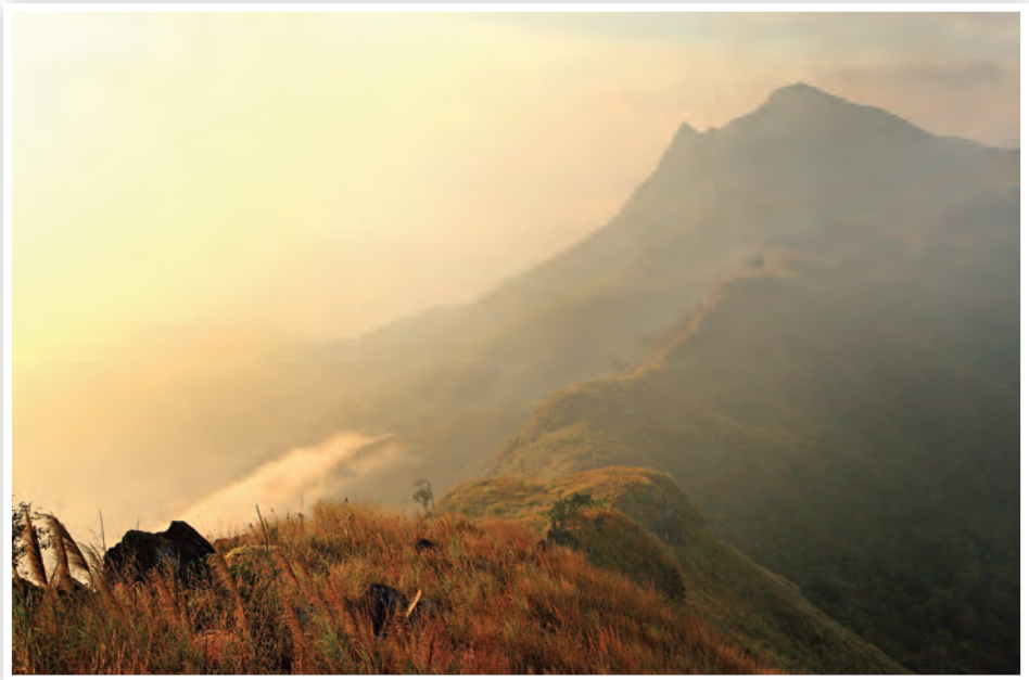
ดอยผาตั้ง

ประกวดไม้ดอกไม้ประดับ กิจกรรมการแสดงดนตรี ในสวนทุกวันเสาร์ ช่วงระหว่างการจัดงาน และการประกวดนางสาวถิ่นไทยงาม จัดโดยเทศบาลนคร เชียงราย สอบถามข้อมูล โทร. ๐ ๕๓๗๑ ๑๓๓๓