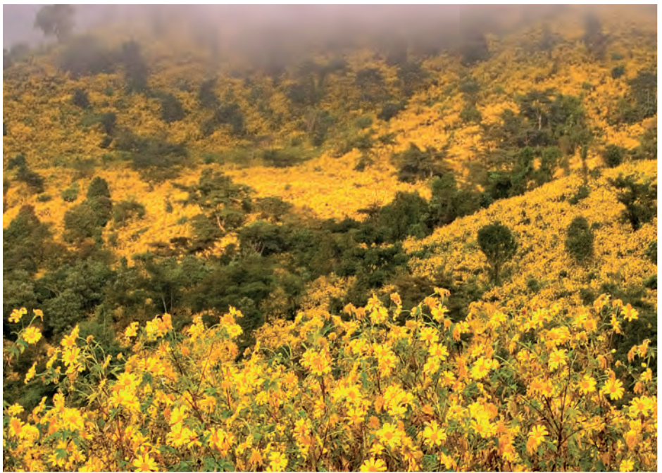
ดอยหัวแม่คำ

สวนแม่ฟ้าหลวง อยู่ด้านหน้าพระตำหนักดอยตุง เป็น สวนดอกไม้เมืองหนาว เช่น ซัลเวีย พิทูเนีย บีโกเนีย กุหลาบ ดอกลาโพง ไม้มั่งคด ไม้ยืนต้น และซุ่มไม้เลื้อยมากกว่า ๗๐ ชนิด รูปปั้นฝีมือของคุณมีเซียม ยิบอินซอย เปิดให้เข้าชมทุกวัน เวลา ๐๖.๓๐-๑๘.๐๐ น. ค่าเข้าชม ๙๐ บาท