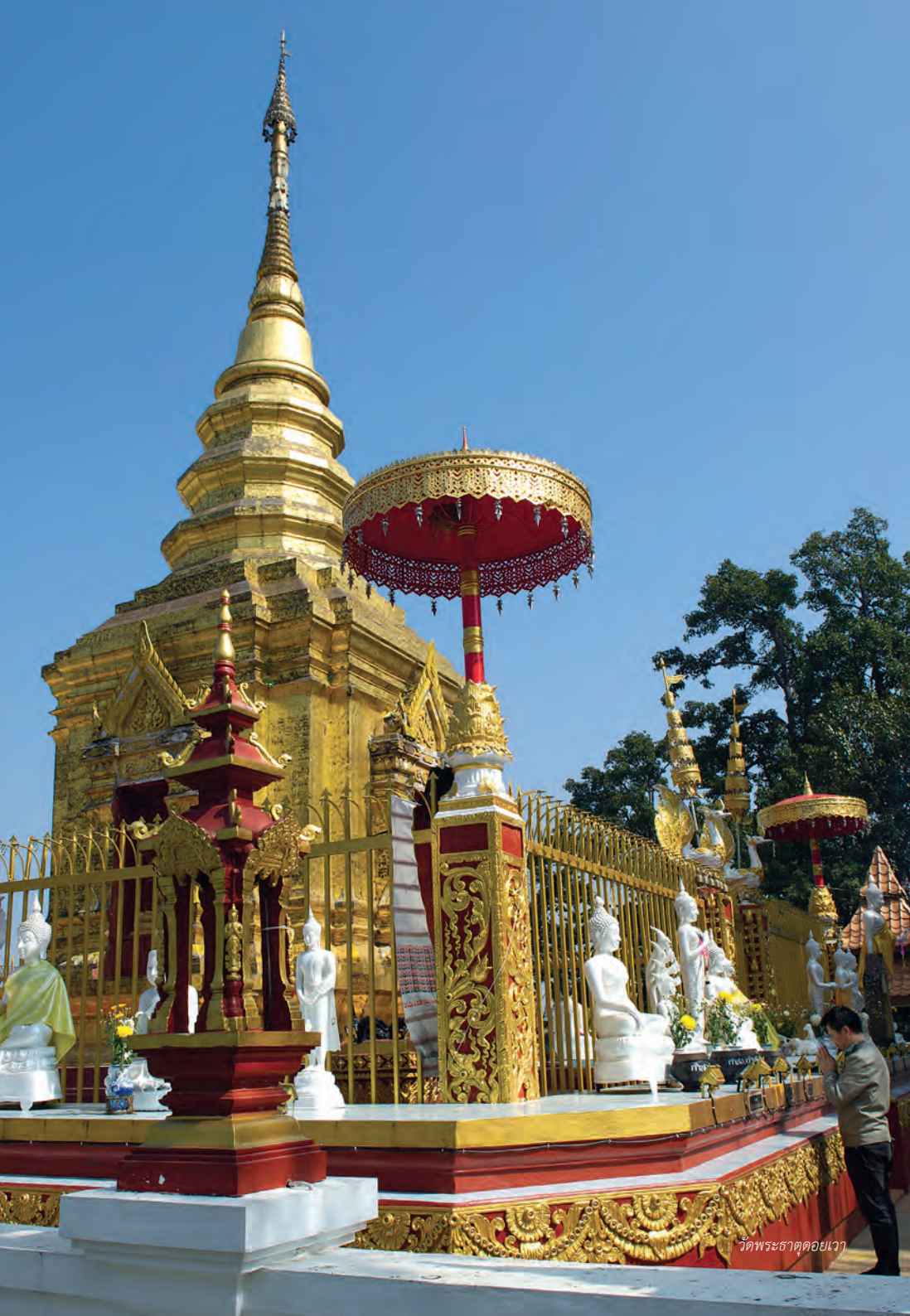
วัดพระธาตุดอยงา