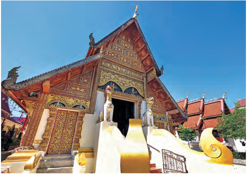
วัดพระสิงห์