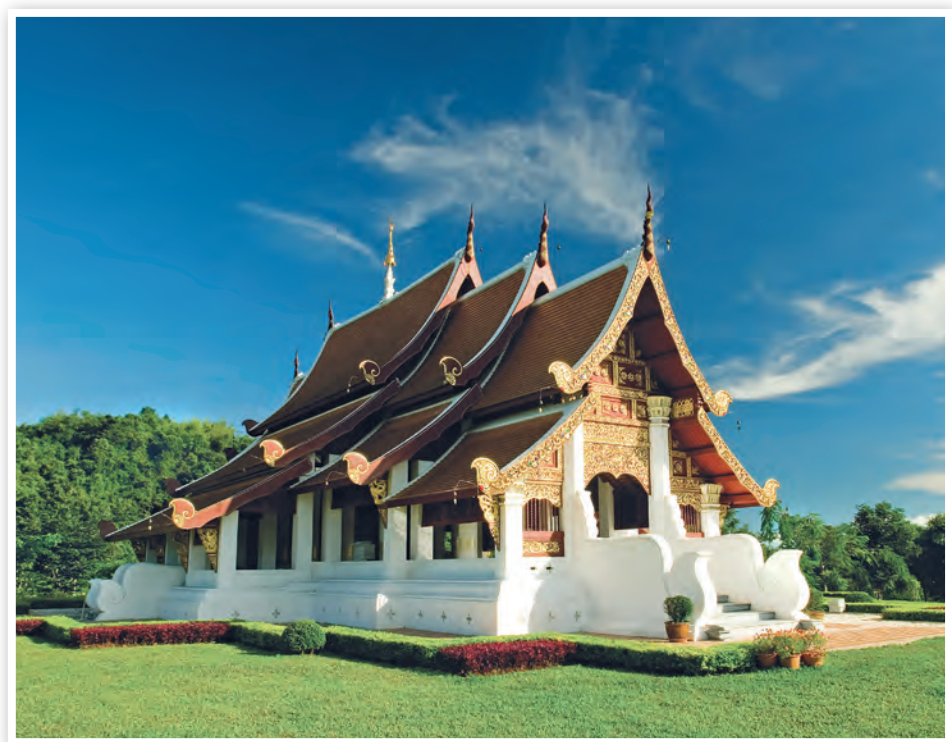
วิหารพระเจ้าล้านทอง

เส้นผ่าศูนย์กลางได้ ๒ เมตร ความสูง ๙ เมตร รวม ๙ องค์ สอบถามข้อมูล โทร. ๐ ๕๓๙๑ ๘๒๔๑, ๐๘ ๙๙๙๙ ๓๖๔๔