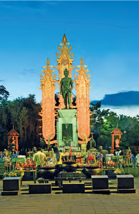
อนุสาวรีย์พ่อขุนเม็งราย

รถโดยสารประจำทาง รถโดยสารธรรมดาและรถโดยสารปรับอากาศ บริษัท ขนส่ง จำกัด โทร. ๑๔๙๐, ๐ ๒๙๓๖ ๒๘๔๓-๖๖ ต่อ ๖๑๔, ๓๒๕ www.transport.co.th และบริษัทสยามเฟิสต์ทัวร์ โทร. ๐ ๒๙๕๕ ๓๖๐๑-๗, ๐ ๕๓๗๐ ๐๐๙๒, ๐ ๕๓๗๙ ๑๒๒๗ www.siamfirst.co.th เชิดชัยทัวร์ โทร. ๐ ๒๙๓๖ ๐๐๔๓ www.cherdchaitour.com มีรถออกจากสถานีขนส่งผู้โดยสารกรุงเทพ (จตุจักร) ถนนกำแพงเพชร ๒ ไปจังหวัดเชียงใหม่ทุกวัน สถานีขนส่งผู้โดยสารจังหวัดเชียงใหม่ (แห่งที่ ๒) โทร. ๐ ๕๓๗๗ ๓๙๘๙