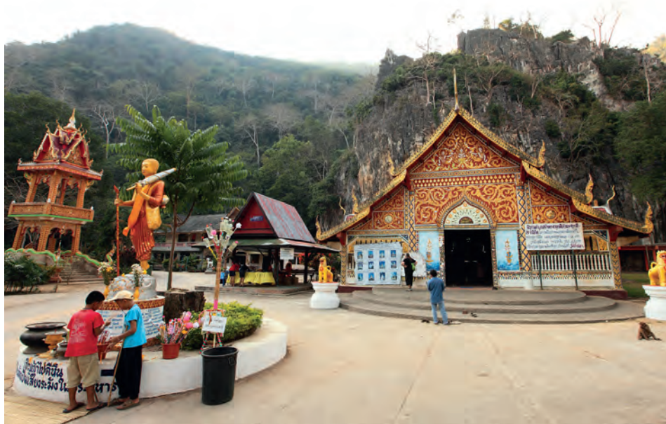
วัดถ้ำปลา

ดอยเวาเป็นที่ตั้งพระบรมราชานุสาวรีย์สมเด็จพระนเรศวรมหาราช และมีหอคมขมิว ซึ่งสามารถมองเห็นทิวทัศน์ทั้งฝั่งไทยและฝั่งเมียนมา การขึ้นไปนมัสการนมัสการองค์พระธาตุสามารถนั่งรถขึ้นไปถึงยอดเขาได้ สอบถามข้อมูล โทร. ๐ ๕๓๗๓ ๑๕๒๗