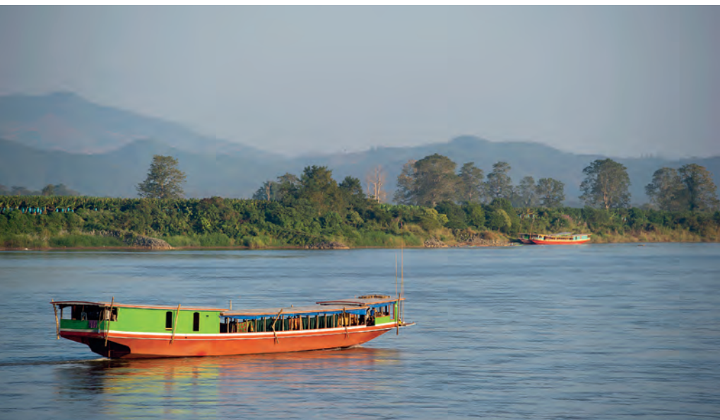
เชียงแสน