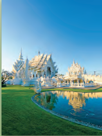
วัดร่องขุน