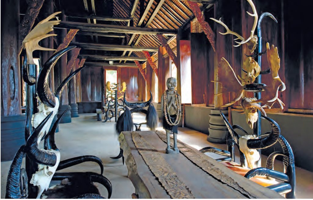
พิพิธภัณฑ์บ้านดำ

ชื่อเป็น “วัดกลางเวียง” และได้สร้างเสตือหรือเสาหลักเมืองไว้เป็นหลักฐาน ต่อมาในปี พ.ศ. ๒๕๓๕ พระครูศาสนกิจโกศล เจ้าอาวาสและคณะได้สร้างหลักเมืองขึ้นมาใหม่แทนของเดิมที่ทรุดโทรมไป และสร้างมณฑปครอบไว้